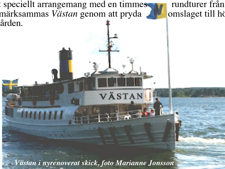
Västan i nyrenoverat skick

Den 1 juli återkom Västan till Stockholm efter den genomgripande renoveringen som bland annat har gett fartyget ett dieselelektriskt maskineri. Sedan fartyget kom i trafik den 16 juli har det varit problem vid två tillfällen, under den första trafikveckan, men därefter har den nya tekniken ombord fungerat till belåtenhet. Under hösten kommer Västan att vara i trafik fram till mitten av september fredag-söndag i sedvanligt trafikprogram. Ett undantag sker den 25 augusti då fartyget och dess ombyggnad kommer att uppmärksammas vid ett speciellt arrangemang med en timmes rundturer från Strömkajen. Inte minst uppmärksammas Västan genom att pryda omslaget till höstturlistan för mellersta skärgården.